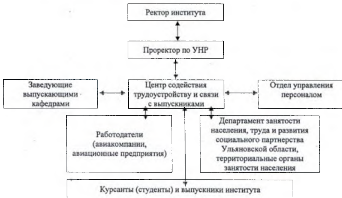
Рис 1. «Схема взаимодействия Центра СТ и СВ с выпускниками, структурными подразделениями института, работодателями»

Схема взаимодействия Центра СТ и СВ с выпускниками, структурными подразделениями института, а также работодателями представлена на рис.1.